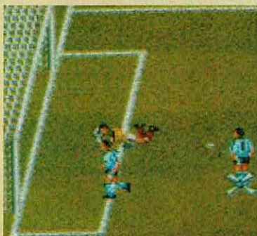
M. UNITED RUROPE

Trata-se de uma nova versão de um famoso jogo de futebol para os computadores de 16-bits e que tem como principais atributos os novos elementos que fizeram falta na versão original. De facto, este MANCHESTER UNITED EUROPE é basicamente uma versão incrementada da primeira, pelo que todos aqueles que não tiveram oportunidade de contactar com este jogo na sua produção inicial podem-no agora fazer, obtendo deste modo a versão deveras completa em atributos indispensáveis num bom jogo de futebol. Em MANCHESTER UNITED EUROPE comandamos a referida equipa britânica de modo a conquistar os diversos troféus, das cinco competições à nossa disposição. A nível técnico um dos grandes pormenores a salientar é o aspecto gráfico que aliado à jogabilidade lhe dão sucesso!