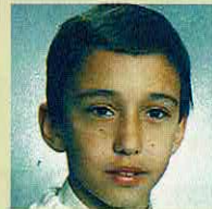
Go-Go Clube Rua Comércio do Porto, 110-R/c Esquerdo 4445 ERMESINDE