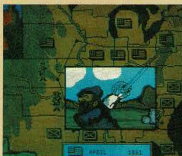
NORTH & SOUTH