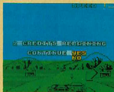
CHASE HQ 2

COMPUTADOR: SPECTRUM. EDITOR: TOPO SOFT. GÉNERO: ACÇÃO/AVENTURA. USA: TECLAS/JOYSTICK. APRESENTAÇÃO: 17. SOM 128 K: 17. GRÁFICOS: 17. USO DA COR: 17. MOVIMENTO: 17. ADICTIVIDADE: 18. TOTAL: 17. OPINIÃO: REVIVER O FILME!