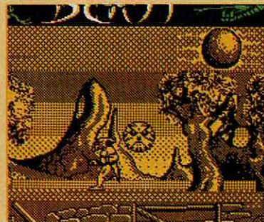
SHADOW OF THE BEAST

COMPUTADOR: SPECTRUM. EDITOR: OCEAN. GÉNERO: ACÇÃO/ESTRATÉGIA. USA: TECLAS/JOYSTICK. APRESENTAÇÃO: 20. SOM 128K: 20. GRÁFICOS: 19. USO DA COR: 19. MOVIMENTO: 20. ADICTIVIDADE: 20. TOTAL: 20. OPINIÃO: UM DOS MELHORES JOGOS DE SEMPRE!