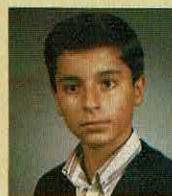
Pedro Miguel da Costa Perfeito Rua de D. António Barroso, 109, 2.º andar 4000 PORTO

APRESENTAÇÃO: 20. GRÁFICOS: 20. SOM 48 K: 19. MOVIMENTO: 20. ORIGINALIDADE: 20. ADICTIVIDADE: 20. TOTAL: 20. OPINIÃO: UMA AVENTURA ORIGINAL!