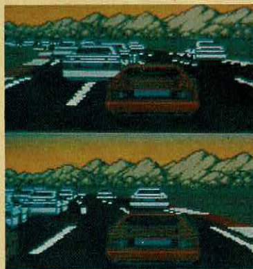
LOTUS ESPRIT TURBO

COMPUTADOR: ATARI ST. EDITOR: ELECTRONIC ARTS. GÉNERO: ACÇÃO/AVENTURA. USA: MOUSE/JOYSTICK. APRESENTAÇÃO: 18. SOM ATARI: 18. GRÁFICOS: 18. USO DA COR: 18. MOVIMENTO: 19. ADICTIVIDADE: 20. TOTAL: 18. OPINIÃO: DIVERTIDO E ESPECTACULAR!!!