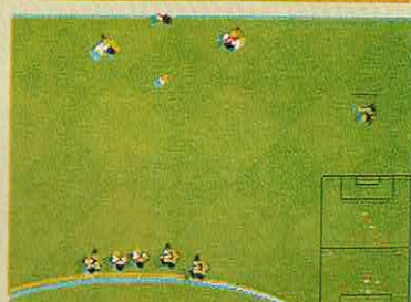
KICK OFF 2

COMPUTADOR: ATARI ST. EDITOR: OCEAN. GÉNERO: PURA ACÇÃO. USA: MOUSE/JOYSTICK. APRESENTAÇÃO: 20. SOM ATARI: 19. GRÁFICOS: 20. USO DA COR: 20. MOVIMENTO: 20. ADICTIVIDADE: 20. TOTAL: 20. OPINIÃO: ESTRONDOSA CONVERSÃO!