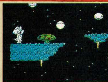
RUFF + REDDY

O argumento deste videojogo gira em torno de um pequeno aprendiz de fantasma que está sendo submetido a um teste, de modo a apurar-se se ele está capacitado a conviver com os fantasmas já graduados. O objectivo é conseguir assustar um certo personagem e, se não o conseguirmos, o nosso pequeno herói terá que frequentar novamente a escola por mais um século. Eis um breve resumo da história-base deste BLINKY'S SCARY SCHOOL, mais um jogo pertencente àqueles denominados «arcade-adventure» e onde a nossa missão resume-se a percorrer todo o mapeado do jogo, recolhendo e largando objectos conforme as situações que nos forem surgindo assim determinem. Durante toda esta aventura, bastante difícil, há que ter em atenção todos os obstáculos.