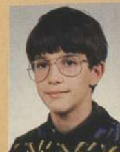
Nuno Miguel Gomes Teixeira Rua Joaquim Leitão n.º 137-1.º Esquerdo 4100 PORTO

APRESENTAÇÃO: 17. GRÁFICOS: 16. SOM 48 K: 16. MOVIMENTO: 17. ORIGINALIDADE: 18. ADICTIVIDADE: 16. TOTAL: 17. OPINIÃO: UM JOGO DIVERTIDO!