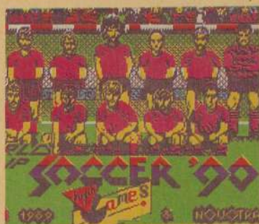
WORLD CUP SOCCER

Mais um jogo de futebol, a juntar à série daqueles que foram especialmente produzidos a pensar no «Mundial» de futebol «Itália 90» a que tivemos oportunidade de assistir. Desta vez, trata-se de WORLD CUP SOCCER ITÁLIA 90 e é, desde já, dos mais fracos jogos do género que se realizaram até hoje! De facto, há pormenores tais como apenas sete jogadores para cada lado, não existência de tempo intermédio (intervalo) e o facto de não se distinguirem os adversários dos nossos, entre outros aspectos, que deixam este WORLD CUP SOCCER muito aquém das expectativas. Graficamente, o jogo pode considerar-se aceitável, com movimentos fluidos, mas é fraco no aspecto geral. Este programa, efectivamente, é só para coleccionadores.