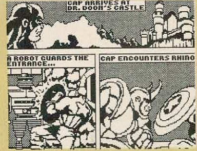
DR. DOOM'S REVENGE

À primeira vista pensei que este jogo fosse uma reedição de um outro jogo, o SUPER STUNTMAN, mas quando deparei com a qualidade do mesmo e com as «inovações», apercebi-me de que realmente se tratava de mais um jogo. Isto só para salientar até onde vai a originalidade deste AMERICAN TURBO KING, também muito ao estilo do clássico SPY HUNTER. No jogo controlamos um carro desportivo, visto de cima, e estamos numa corrida (contra quem?) constituída por cinco fases, na qual podemos abater todos os obstáculos móveis, terrestres e aéreos, que nos surgem pelo caminho. TURBO KING é deveras decepcionante a nível da originalidade e possui, a nível de cenários, uma enorme falta de criatividade e mesmo de cuidado na programação!