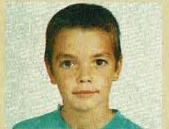
Cláudio Fernando Pereira Rua Tourais, 528- -2.º D.º 4450 MATOSINHOS

APRESENTAÇÃO: 18. GRÁFICOS: 18. SOM 48 K: 11. MOVIMENTO: 15. ORIGINALIDADE: 19. ADICTIVIDADE: 19. TOTAL: 19. OPINIÃO: MARAVILHOSO!