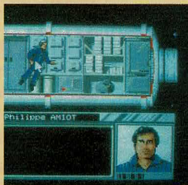
MURDERS IN SPACE

COMPUTADOR: AMSTRAD. EDITOR: LORICIEL. GÉNERO: REFLEXÃO. USA: TECLAS/JOYSTICK. APRESENTAÇÃO: 16. SOM AMSTRAD: 13. GRÁFICOS: 16. USO DA COR: 16. JOGABILIDADE: 17. ADICTIVIDADE: 17. TOTAL: 16. OPINIÃO: UMA IDEIA ORIGINAL!