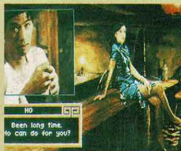
HEART OF CHINA