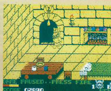
SPIKE IN TRANSYLVANIA

Estamos perante a sequela de mais um jogo baseado no mundo automobilístico e que tem por título 3D Stock Car Racer 2. Embora os cenários e as pistas não sejam tridimensionais, os veículos são vistos de um ângulo de topo tridimensional, factor que lhe concede a tal terceira dimensão. O jogo, em si, é no género dos clássicos tipo Super Sprint, só que este 3D Stock Car Racer 2 dá-nos a possibilidade de jogarmos em campeonatos de quatro pistas, de uma série de trinta e tal, e ainda a possibilidade de poderem participar quatro jogadores ao mesmo tempo, dividindo o controlo dos veículos por teclado e joysticks. Sem dúvida, existem melhores programas no género, mas experimentar coisas novas pode ser ainda motivo para a aquisição de programas deste género. A experimentar!