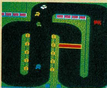
3D STOCK CAR RACER 2