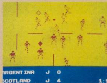
WORLD CLASS RUGBY

Os fans da famosa luta livre americana vão simplesmente adorar este jogo, pois sem dúvida é o melhor no seu género. Este WRESTLEMANIA é um jogo para um ou dois jogadores e, inicialmente, temos a possibilidade de optar entre três lutadores profissionais, cada um com as suas características e formas de lutar especiais. Independentemente da escolha que façamos, o objectivo é tornarmo-nos o campeão da World Wrestling Federation! WRESTLEMANIA, tecnicamente é um jogo que vive à base da animação dos seus personagens, já que a nível de cenários resume-se a um enorme ringue de luta livre. Mas a enorme variedade de movimentos e as combinações possíveis de se efectuar com eles, é que fazem deste WRESTLEMANIA um jogo extremamente adictivo!