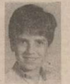
JOSÉ MANUEL DA SILVA SOTO TRAVESSA HENRIQUE GALVÃO, 31 V. N. GAIA - MIRAMAR 4405 VALADARES

EDITOR: ALTERNATIVE. GÉNERO: ACÇÃO. TECLAS: PODEM SER DEFINIDAS. JOYSTICKS: SINCLAIR/KEMPSTON. APRESENTAÇÃO: 12. SOM 48K: 7. GRÁFICOS: 14. USO DA COR: 12. MOVIMENTO: 12. ADICTIVIDADE: 9. TOTAL: 12. OPINIÃO: RAZOÁVEL!